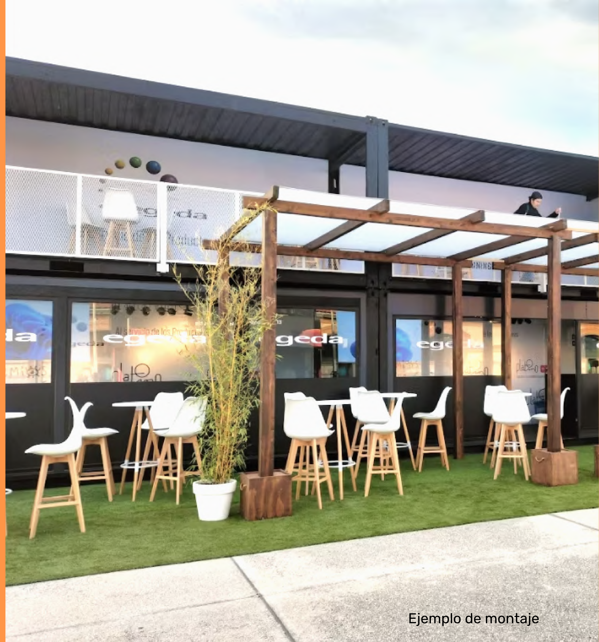
Ejemplo de montaje