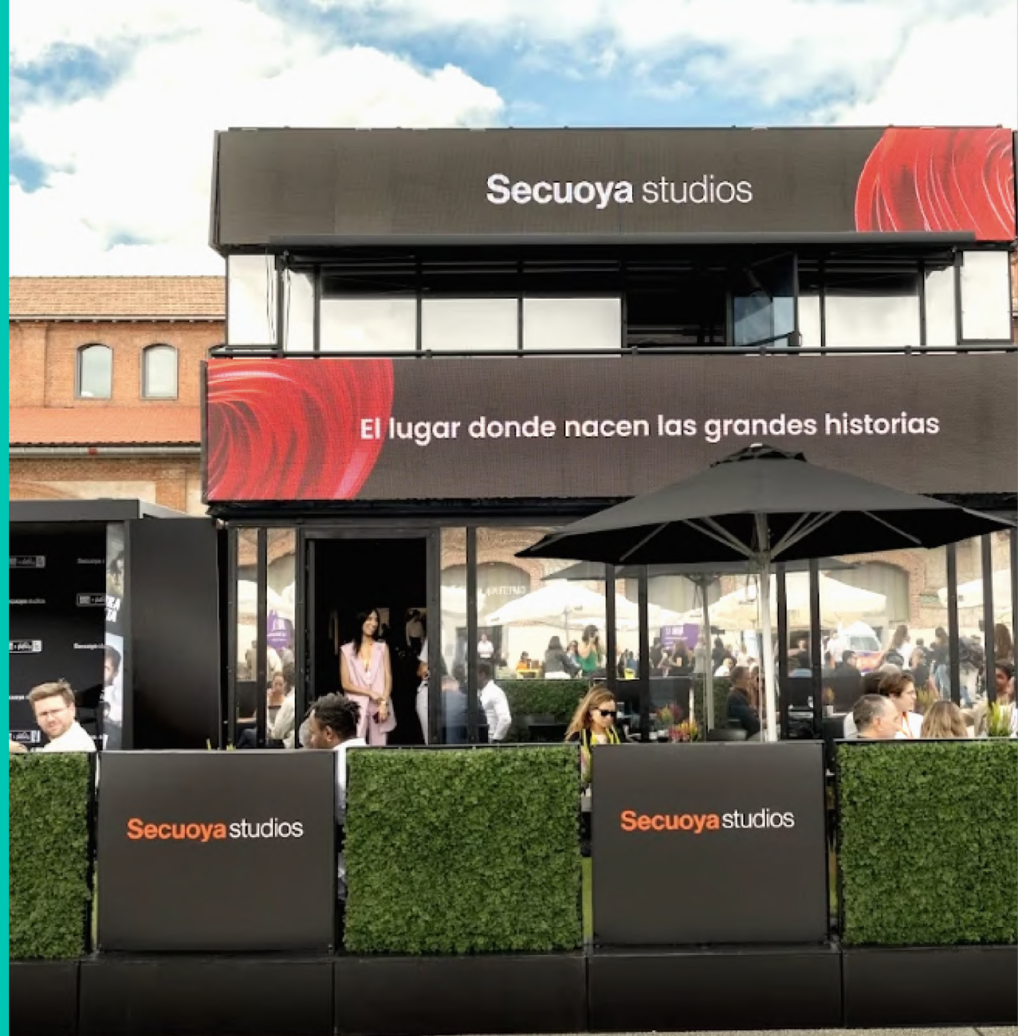
Ejemplo de montaje