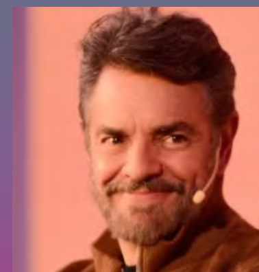
EUGENIO DERBEZ Actor, Dir., Prod. & Chairman & Co-Founder 3PAS Studios México