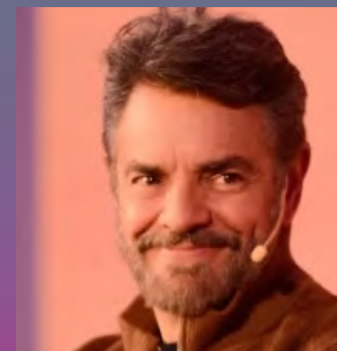
EUGENIO DERBEZ Actor, Dir., Prod. & Chairman & Co-Founder 3PAS Studios México